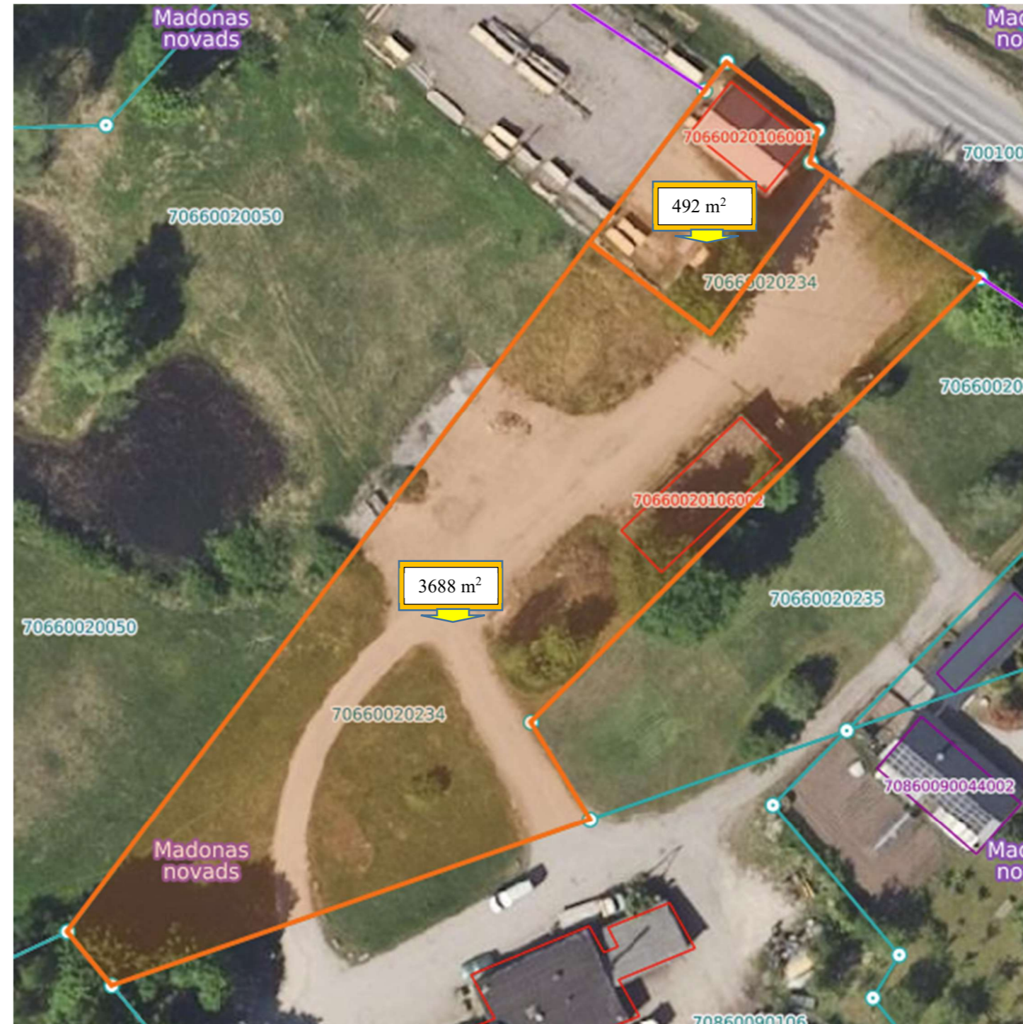
Zemes vienības ar kadastra apzīmējumu 70660020234 sadalīšanas shēma*

Datu avots: https://www.lvmgeo.lv/ 2026. gada informācija